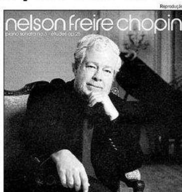
A CAPA DO CD: uma sonata e 12 estudos em interpretação grandiosa.